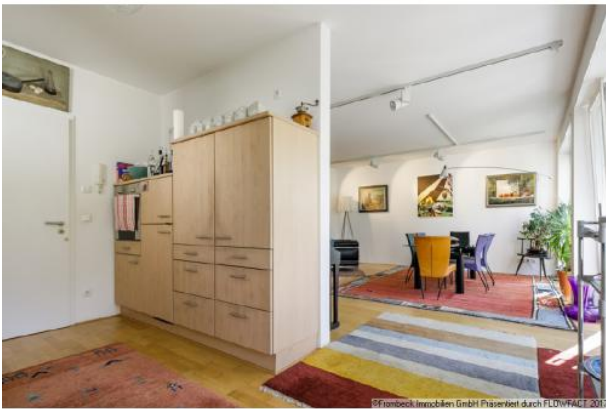
Essbereich und offene Küche