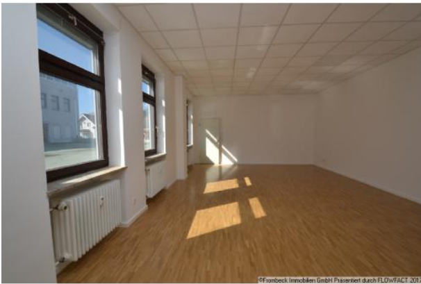
Tagelicht und hell