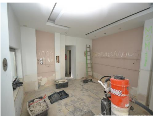
Sanierung Raum 2