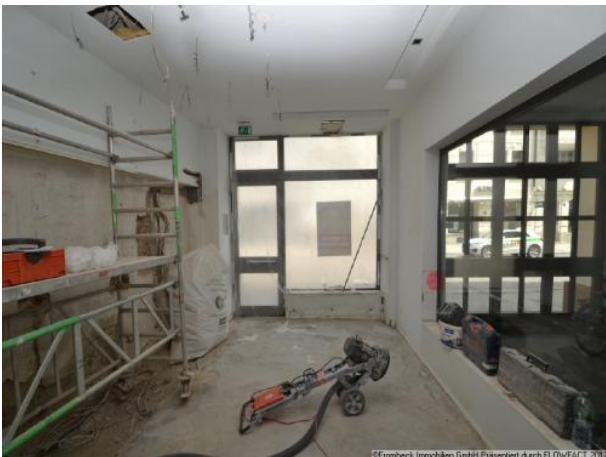
Sanierung Raum 1